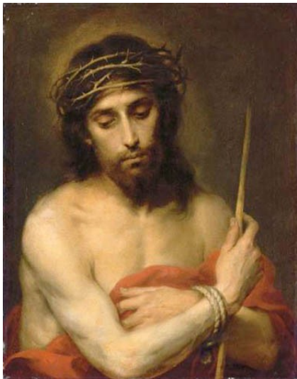
Murillo Cristo, el varon de los dolores 3,6 millones € Christie's, Londres 2005